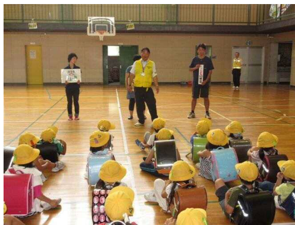
大通小学校での実施状況

件名 新潟市防犯活動・交通安全功労者表彰式 内容 新潟市防犯月間（10月19日）に、安心・安全なまちづくりに寄与したと認められる防犯活動・交通安全功労者に対して感謝状を贈呈した。