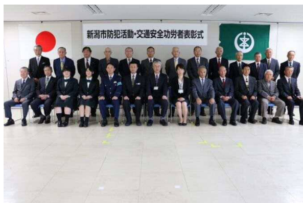
防犯活動・交通安全功労者表彰式の状況