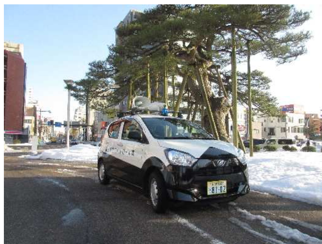
青色回転灯パトロール車

実施内容 青色回転灯パトロール車により、下校時間帯の見守り活動をはじめ、空き巣ねらい、車上ねらい、自転車盗などの警戒パトロールを実施