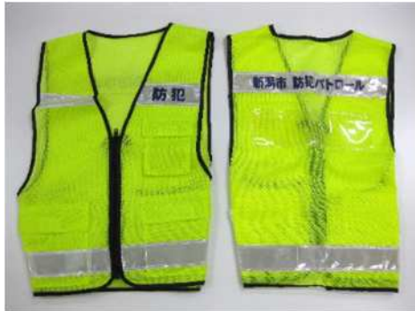
パトロール用ベスト

実施内容 防犯ボランティアネットワーク登録団体へのパトロール用ベスト等の貸与のほか、見守り活動をする団体に活動周知看板を、個人にながら見守り腕章の配布を実施