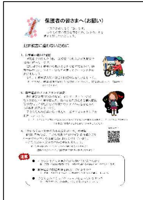
中学生保護者向け