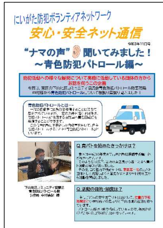
安心・安全ネット通信