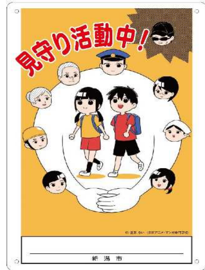
見守り活動周知看板