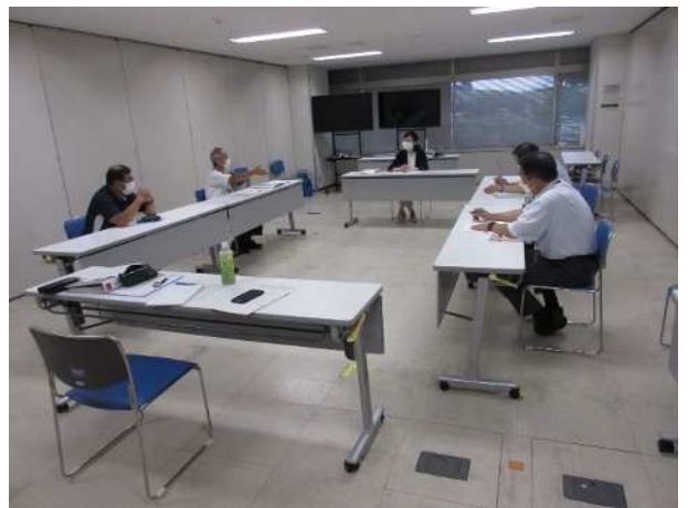
監修者との検討会