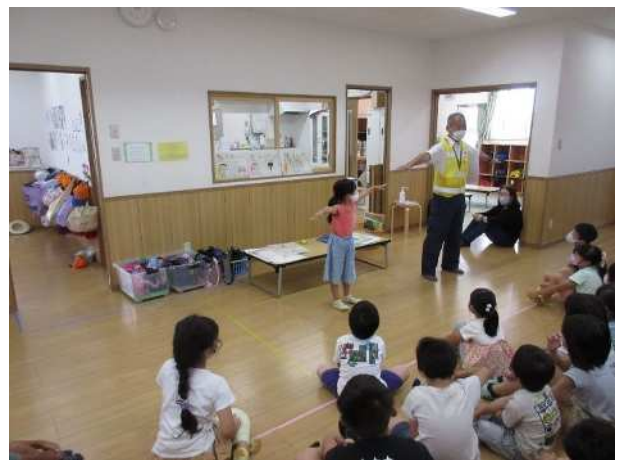
ひまわりクラブでの防犯講習会の様子