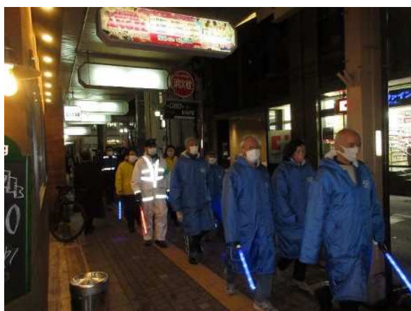
新潟駅前パトロール

件名 新潟駅前・古町地区の環境健全化パトロール 参加団体 各地区の地域団体（新潟駅前セーフティゾーン活動委員会、新潟古町周辺地区環境健全化実行委員会）、新潟公務員法律専門学校、警察 実施内容 関係機関・団体と連携して、新潟駅前地区及び古町地区繁華街の定期的なパトロール活動を実施した。