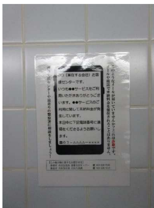
スミッシング等に関する注意喚起の掲示物