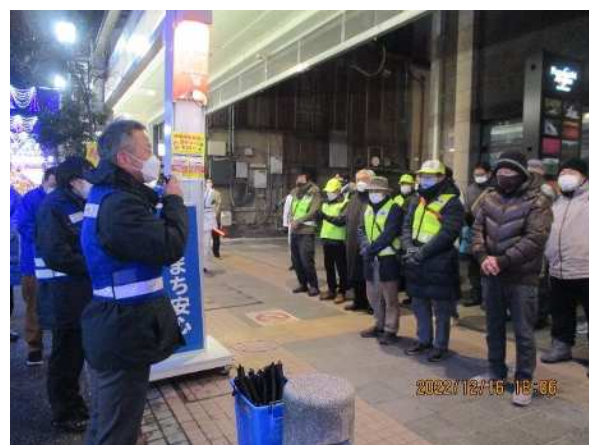
古町地区パトロール

件名 暴力団排除の啓発活動 実施内容 市内の中学3年生を対象に啓発チラシを配布 また市ホームページに、暴力団排除教育の啓発マンガを掲載した。