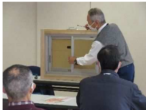
コミュニティ協議会での防犯講習会の様子