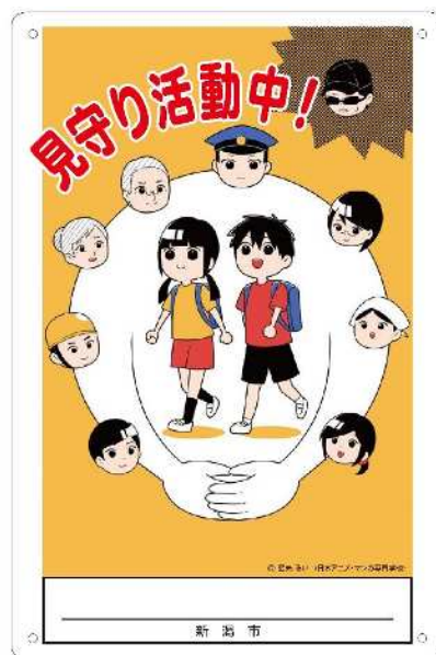
見守り活動周知看板