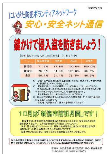
安心・安全ネット通信