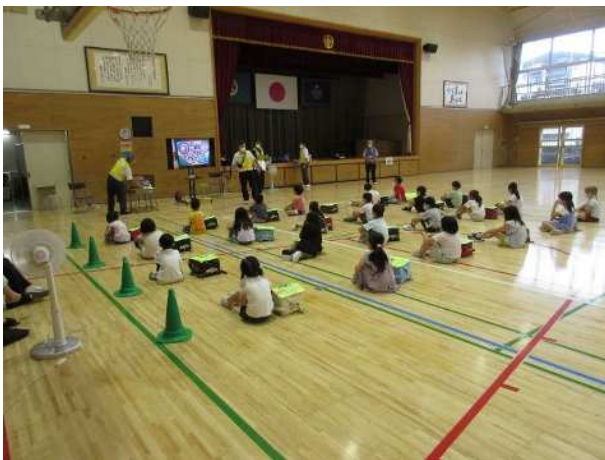
体験型安全教室の様子

実施内容 子どもが不審者と対峙した際、自らの判断で危険から回避する能力を身につけてもらうことを目的として、全市立小学校において1年生を対象に実施した（民間会社による実施2校を含む）。