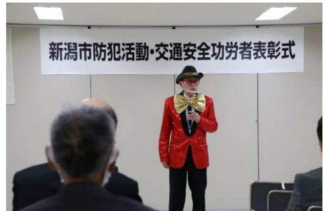
防犯リーダー講習会の様子

件名 「新潟市の犯罪状況」の市ホームページの掲載 実施内容 新潟市の犯罪発生に関する統計資料や防犯のポイントについて市ホームページに掲載した。