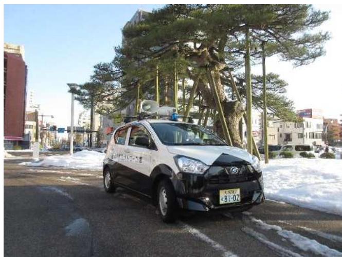
青色回転灯パトロール車

実施内容 青色回転灯パトロール車により、下校時間帯の見守り活動をはじめ、空き巣ねらい、車上ねらい、自転車盗などの警戒パトロールを実施した。