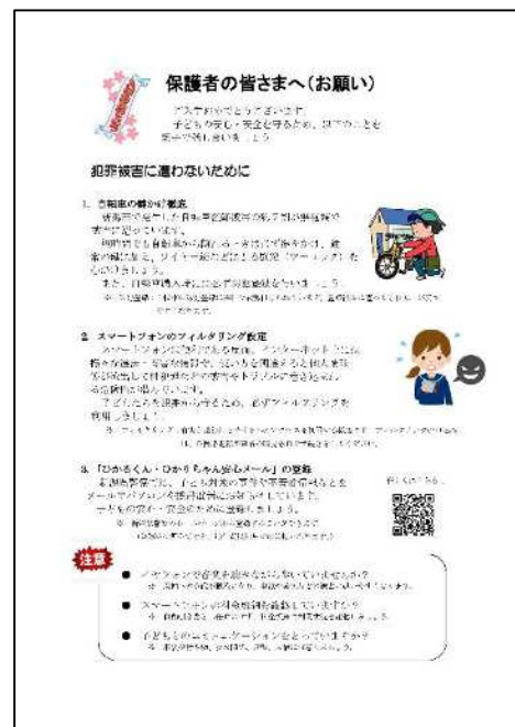
中学生保護者向け