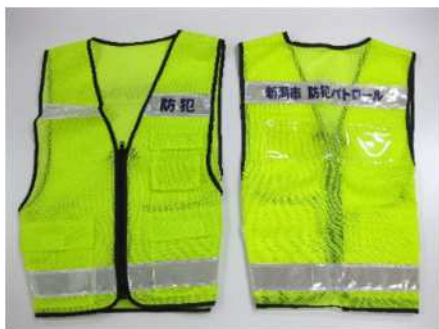
パトロール用ベスト

実施内容 防犯ボランティアネットワーク登録団体へのパトロール用ベスト等の貸与のほか、見守り活動をする団体に活動周知看板を、個人にながら見守り腕章の配布を実施した。