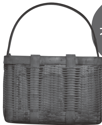
むかしのエコバッグ「買い物かご」

広大な越後平野に位置する新潟市域には、海岸、大小の河川と、潟、山地、丘陵など多様な自然環境があります。こうした自然環境を利用し、手を加えることで、くらしを営んできました。環境という視点から市域のくらしと仕事を振り返ります。