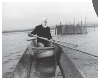
福島潟の扇網漁