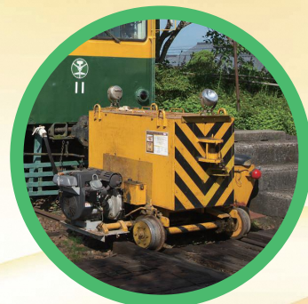
車両移動機「アント」で 電車を走行させます

1列車あたり50名 15:40発・16:20発は往年の 満員電車を再現! 80名のお客様にご乗車いただけます!