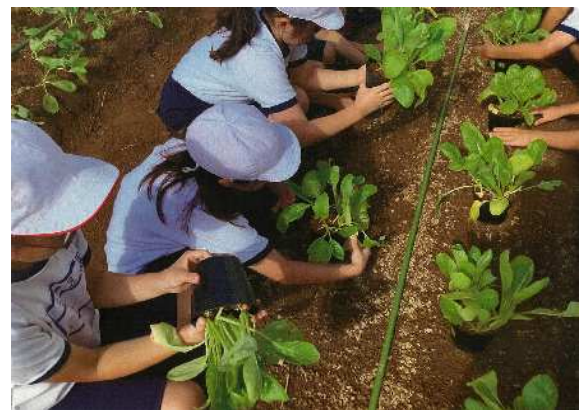
植え付け時の様子