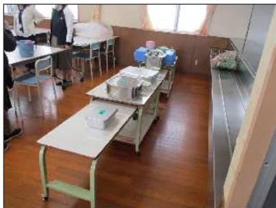
配膳シミュレーション