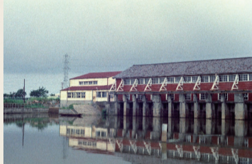
東洋一といわれた栗ノ木排水機場