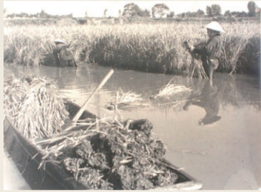
田舟を使った稲刈りの様子