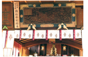
▲金刀比羅神社(寄合町)の彫刻絵馬には、廻船問屋の船「白山丸」が嵐に遭い、救出される様子が彫られている

コース概要 歴史博物館みなとぴあから折り返し地点の開運稲荷神社(四ツ屋町3)まで往復約45分、日和山住吉神社(東堀通13)から旧小澤家住宅(上大川前通12)、早川堀通りを巡る場合は約60分 ※見学時間含まず