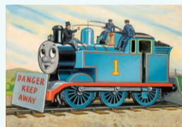
© 2020 Gullane (Thomas) Limited. © 2020 HIT Entertainment Limited. レジナルド・ダルビー『トーマスのさかなつり』1949年

¥一般200円、高校・大学生150円、小・中学生100円 ※企画展観覧券で観覧可。1/16(土)14:00に展示解説を実施