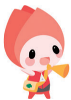
新潟市防災マスコットキャラクター キョージョ