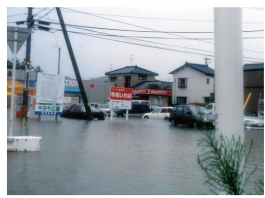
平成10年8月4日8.4水害(新潟市西区)

地域で防災士の活動を始めて、今年で7年目になります。中学校の防災学習や地域の講習会で、災害への備えの大切さを話しています。 そこで一番に伝えていることは、家族や友達、近所の人と一緒に災害について考えてほしい、ということです。ハザードマップを見ながら「町内は川が近いから水害が怖いね」などの段階でどこに避難して、どうやって連絡を取り合おうか」などと話し合うことで、一人で考えるよりも災害の危険性や避難行動をしっかりと理解できるからです。 また、家族で買い物や散歩に行くついでに避難所までの経路を歩いて、危険な場所が無いか確認するだけでもお勧めしています。