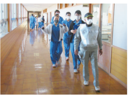
他のグループとの接触を避けて避難室まで移動する様子