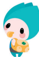
新潟市防災マスコットキャラクター ジーゴ