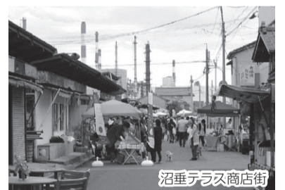
沼垂テラス商店街