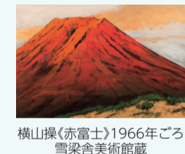
横山操「赤富士」1966年ごろ 雪室舎美術館蔵