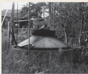
自家用の天然ガスタンク (昭和59年、中央区女池付近)