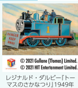
レジナルド・ダルビー「トーマスのさかなつり」1949年