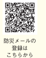
防災メールの登録はこちら