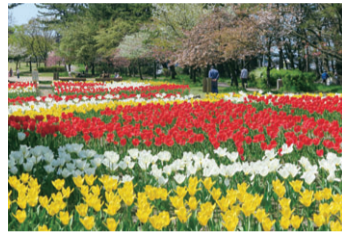
▲休日には親子連れや散歩の人などでにぎわいます。人と人との距離を空けて歩きましょう

コース概要 1周約800mのコース。一部手すりのある急な坂道有り。 ※駐車場約30台分。休憩所の感染症対策に協力をお願いします