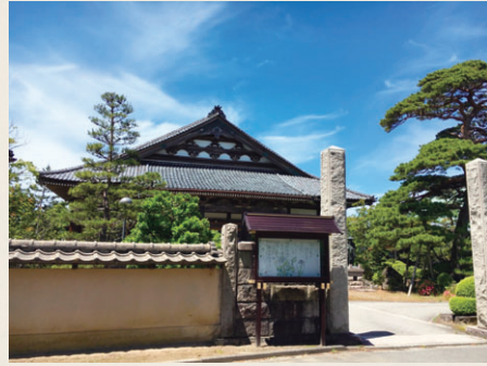
現在の西遊寺。 現存する本堂は明治11(1878)年建築のもの

このような人の移動に伴った寺院の移転は、主に近世初期に盛んでした。戦乱や浄土真宗への弾圧から逃れるためなど理由はさまざまでしたが、他国からの人の流入・定住は蒲原平野の開発や村落形成の発展に大きな影響を及ぼしました。