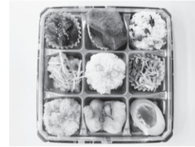
まんぷく和み弁当(キューピット)

電話番号案内 市急患診療センター ☎025-246-1199 口腔保健福祉センター ☎025-212-8020 西蒲原地区休日夜間急患センター ☎0256-72-5499 水道局 ☎0120-411-002(または☎025-266-9311)