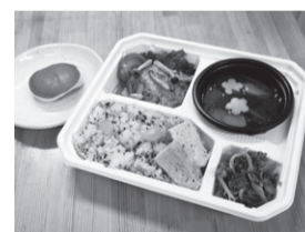
春の味わい弁当(わくわくファーム)