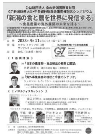
G7新潟財務大臣・中央銀行総裁会議開催記念シンポジウム「新潟の食と農を世界に発信する」