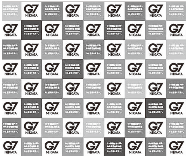
記者会見用バックボード