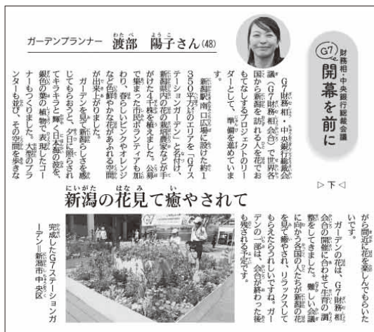
ふむふむ記事(2023年(令和5年)5月4日掲載)