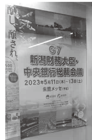
ポスター(新潟駅東西連絡通路)