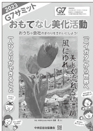
2023G7サミットおもてなし美化活動