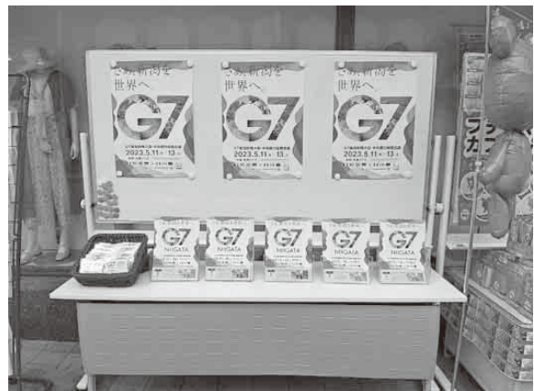
ほんちよう日曜マルシェ