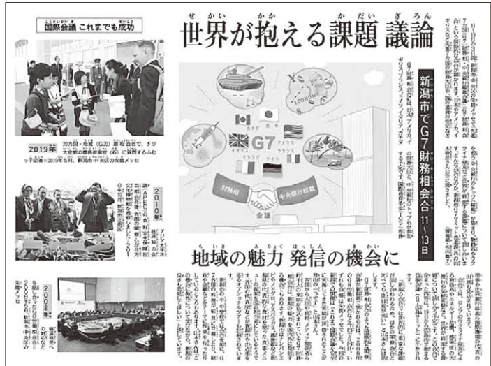
ふむふむ記事(2023年(令和5年)5月1日掲載)