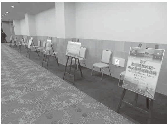
ラムサール条約湿地自治体認証記念シンポジウム