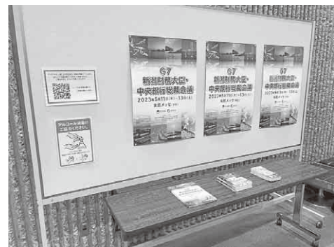
ワンコインイタリア映画祭