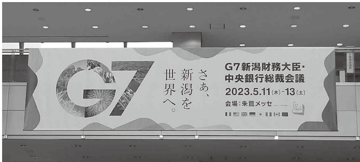
横断幕(新潟市役所)