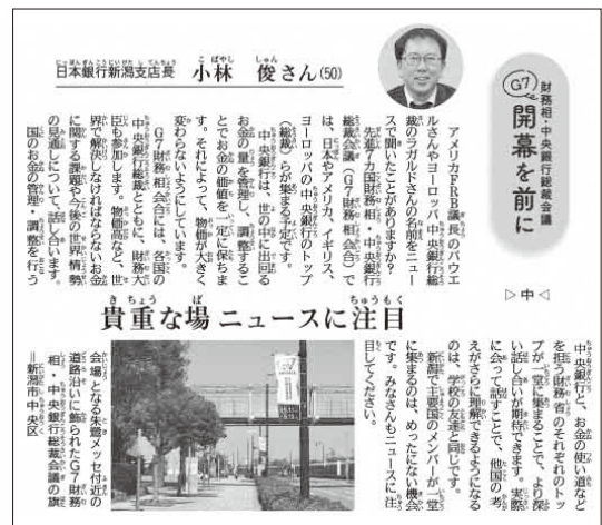
ふむふむ記事(2023年(令和5年)5月3日掲載)