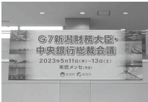
横断幕(新潟市役所)