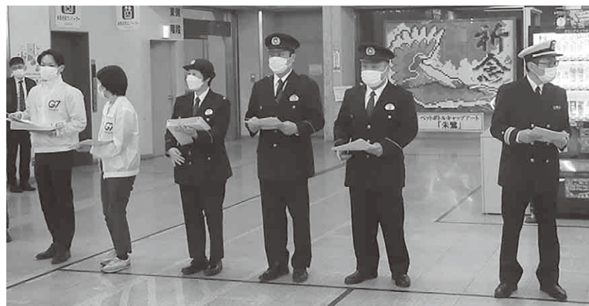
チラシ配布の様子