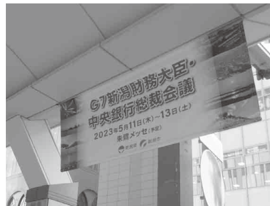
横断幕(古町ルフル前)