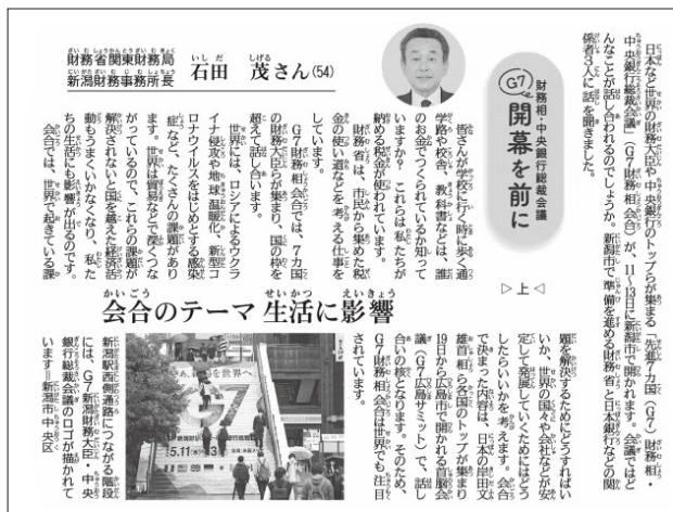
ふむふむ記事(2023年(令和5年)5月2日掲載)