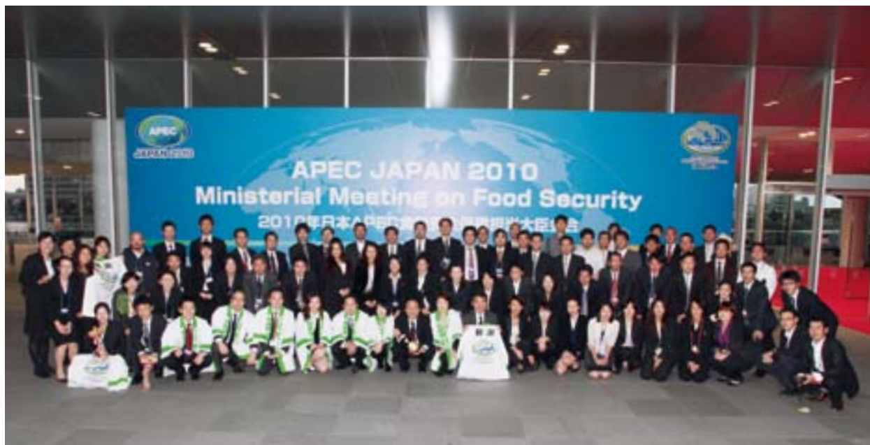
APEC新潟会合を支えた皆さん