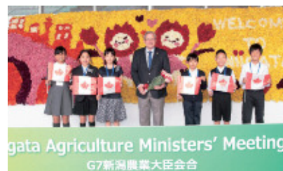
【2016年G7新潟農業大臣会合の様子】