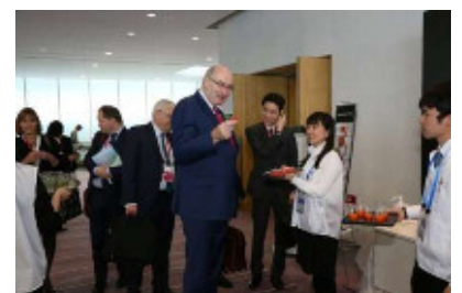
【2016年G7新潟農業大臣会合の様子】

募集開始は9月中旬頃を予定しており、詳細が決定次第、新潟市HPや市報にいがたなどでご案内いたします。