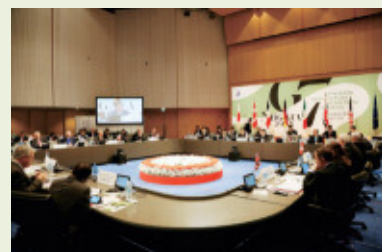
【2016年G7新潟農業大臣会合の様子】

なお、G20サミットの日本での開催は2019年が初めてであり、首脳会議のほか関係閣僚会合が各地で開催されます。