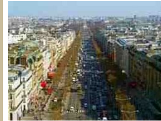
シャンゼリゼ大通り(パリ)…約2km