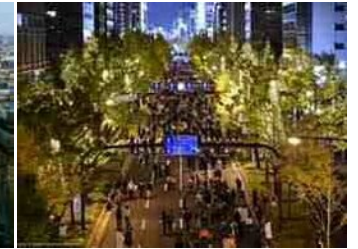
御堂筋(大阪市)…約4km ※写真はイルミネーションイベント