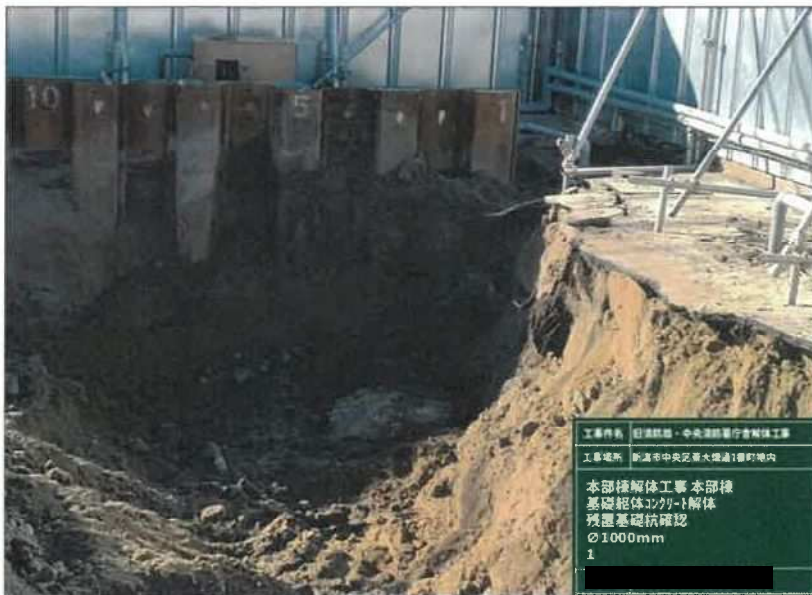
写真区分: 施工状況写真 写真タイトル: 本部棟解体工 事 本部棟 基礎躯体コンクリ ート解体 残置基礎杭確認 10 00mm 1