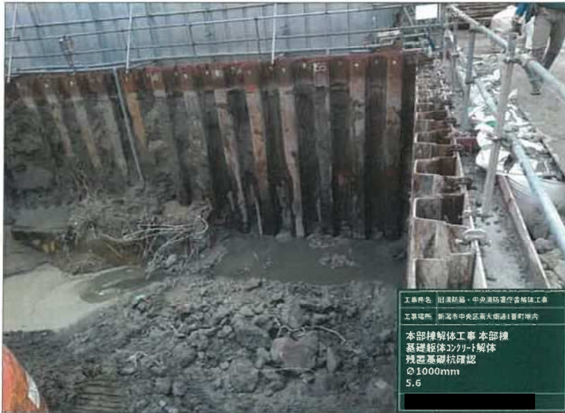
工事種名 旧消防局・中央消防署庁舎解体工事 工事場所 新潟市中央区高天畑通1番町地内 本部棟解体工事 本部棟 基礎躯体コンクリート解体 残置基礎杭確認 φ1000mm 5.6