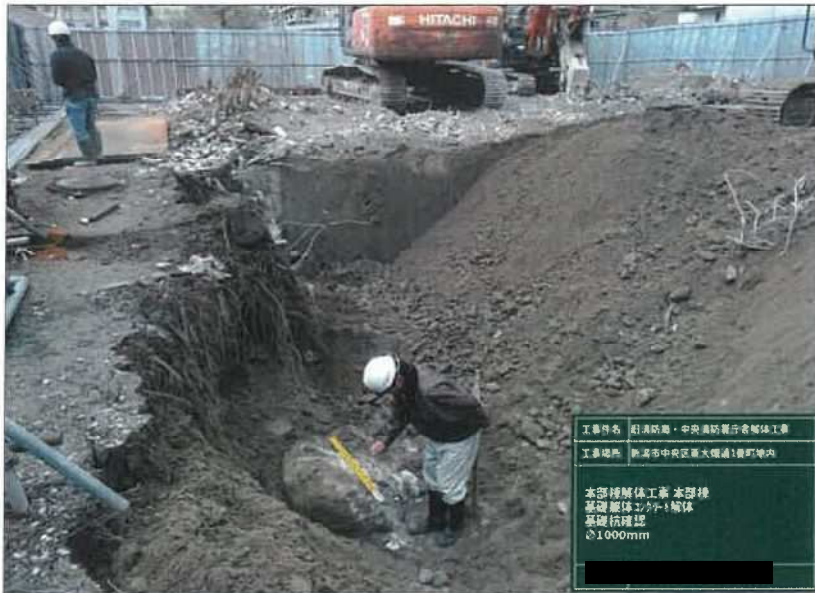
工事件名 新潟防衛・中央消防署庁舎解体工事 工事場所 新潟市中央区新大塚通1番町地内 本部棟解体工事 本部棟 基礎 躯体コンクリート解体 基礎杭確認 φ1000mm