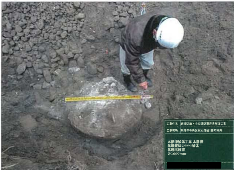
工事件名 新潟防衛・中央消防署庁舎解体工事 工事場所 新潟市中央区新大塚通1番町地内 本部棟解体工事 本部棟 基礎 躯体コンクリート解体 基礎杭確認 φ1000mm