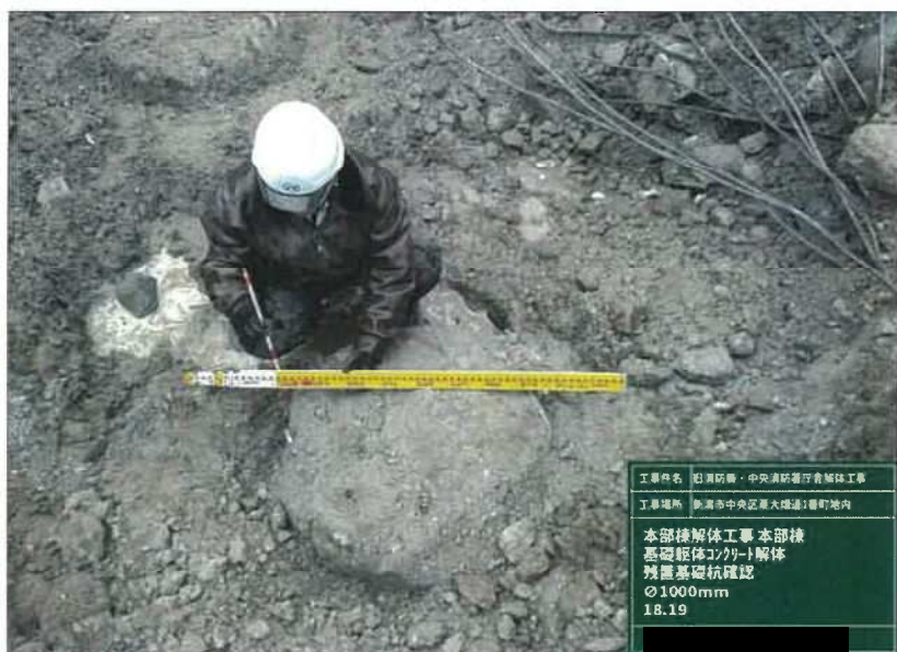
工事名 石原防壁・中央員所集行舎解体工事 工事場所 新潟市中央区幸火樋通1番町地内 本部棟解体工事 本部棟 基礎躯体コンクリート解体 残置基礎杭確認 φ1000mm 18.19