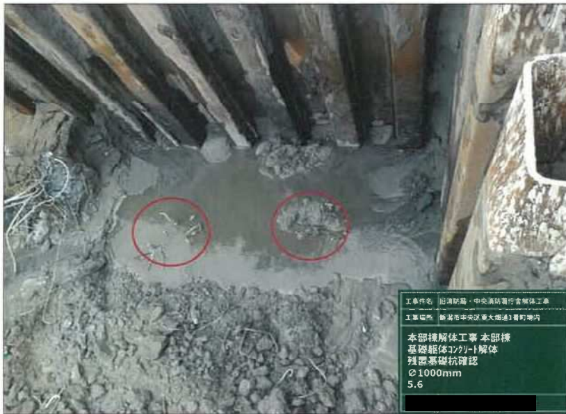
工事種名 旧消防局・中央消防署庁舎解体工事 工事場所 新潟市中央区高天畑通1番町地内 本部棟解体工事 本部棟 基礎躯体コンクリート解体 残置基礎杭確認 φ1000mm 5.6