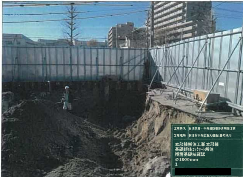
写真区分: 施工状況写真 写真タイトル: 本部棟解体工 事 本部棟 基礎躯体コンクリ ート解体 残置基礎杭確認 10 00mm 1