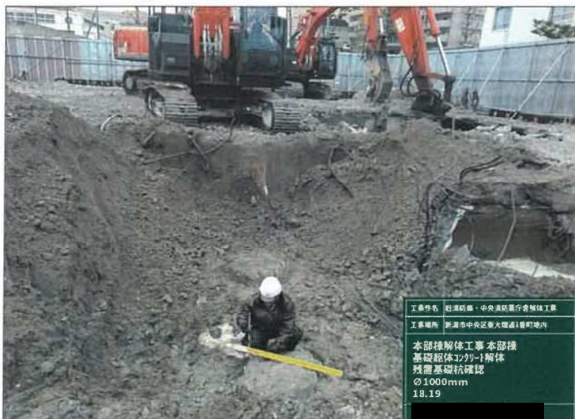
工事名 石原防壁・中央員所集行舎解体工事 工事場所 新潟市中央区幸火樋通1番町地内 本部棟解体工事 本部棟 基礎躯体コンクリート解体 残置基礎杭確認 φ1000mm 18.19