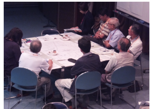
第1回ワークショップの様子

まず、新潟市から公共施設に関する現状について説明があり、その後、7～8名ずつに分かれてグループ討議を行いました。グループ討議では、本ワークショップと検討プロセスの趣旨を把握した上で、地域の現状や公共施設を取り巻く課題について、幅広く意見を交換しました。最後に、各グループでの討議内容を発表しあい、参加者全員で情報を共有し、3時間にわたるワークショップを終えました。