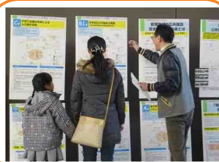
オープンハウスでのパネル展示の様子