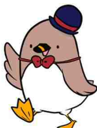
福島潟マスコットキャラクター「クイクイ」