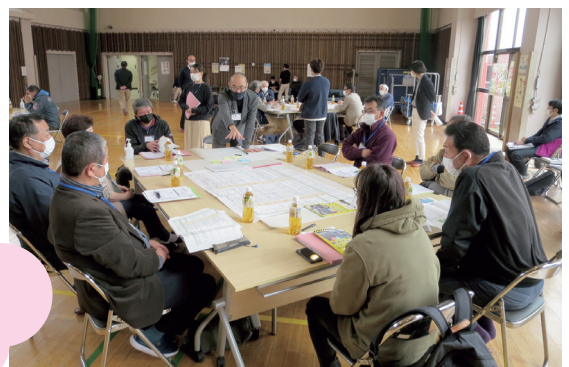
第3回WSの様子 大江山農村環境改善センターにて